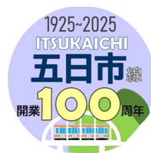
6号車ヘッドマーク