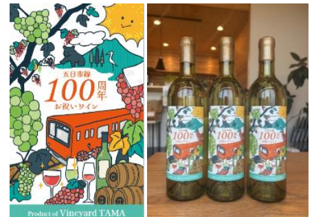
【オリジナルラベル】