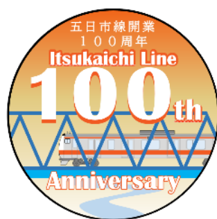
1号車ヘッドマーク