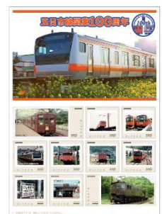
【100周年記念切手イメージ】